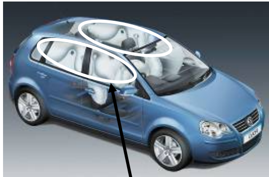
基準不適合発生箇所