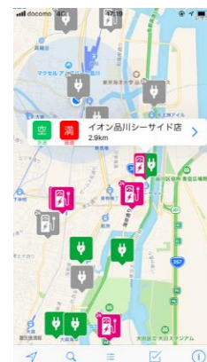
充電ステーション検索アプリ“Easy EV”

フォルクスワーゲン グループ ジャパン 株式会社(代表取締役社長:ティル シェア、本社:愛知県豊橋市、略称:VGJ)は、昨年10月に導入した電気自動車(以下:EV)の『e-Golf』(イーゴルフ)に内装の質感を高め、保証やサービスを充実させた特別仕様車『e-Golf Premium』を本日より全国のフォルクスワーゲン正規ディーラーで販売します。さらに全国約2万基のNCS(合同会社日本充電サービス)の充電ネットワークで利用可能な独自カード『Volkswagen 充電カード』のサービスも本日より提供開始いたします。これに伴い、『e-Golf』の販売を従来のWebによる受付から店頭販売に切り替え、全国のフォルクスワーゲン正規ディーラーにて取扱いを開始いたします。