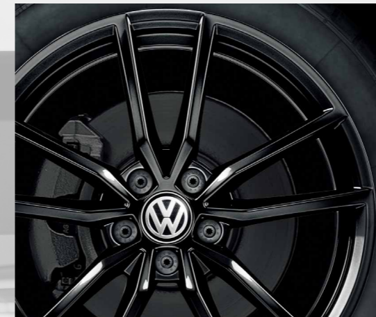
Pretoria /プレトリア ブラック (7.5J-18)