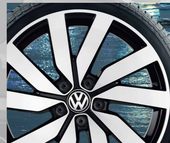
Marseille /マルセイユ (7J-18 / 7.5J-18 / 8J-18)