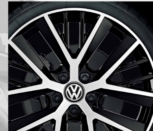
Twinspoke /ツインスポーク (7.5J-19)