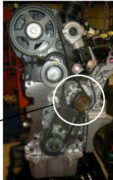
□ = 交換する部品