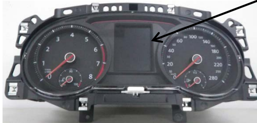
メータークラスター