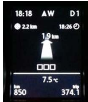
マルチファンクションインジケーター