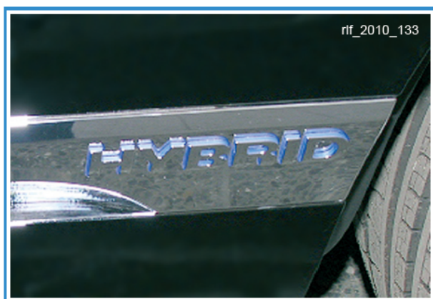
図：Touareg Hybrid の識別