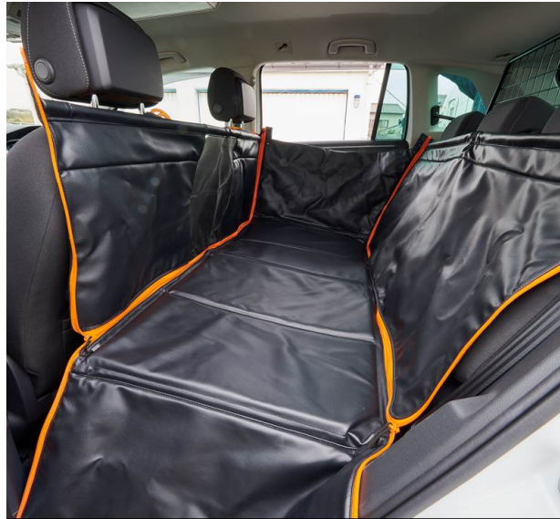
車両実装状態 (Golf Variant Highline)