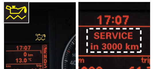
補充の必要を示すインジケータ オイル交換時期(距離)を示すインジケータ

フォルクスワーゲン車のエンジン特性に合わせてブレンドされた純正オイルが、最長2年または3万キロでのオイル交換サイクルを実現。搭載されたセンサーが走行距離や経過年数に応じてオイル性能変化を察知し、補充や交換時期をドライバーにお知らせします。(車種により表示内容が異なります。インジケータに表示されない車種が一部あります。)