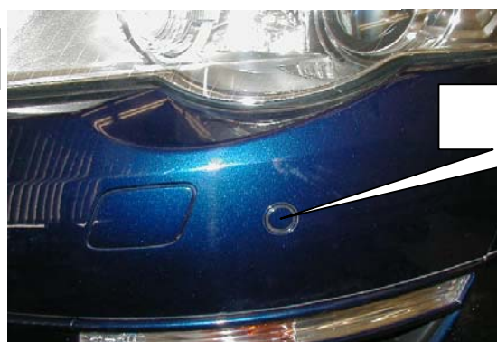
障害物検知センサー