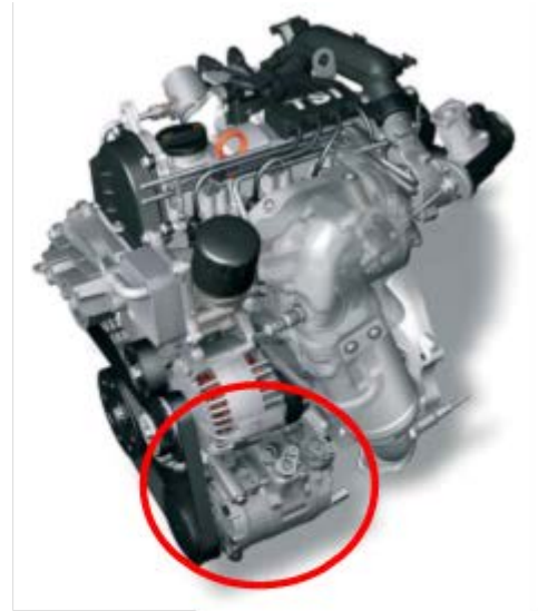
エアコンコンプレッサー