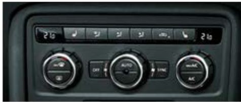
空調制御コンピュータ