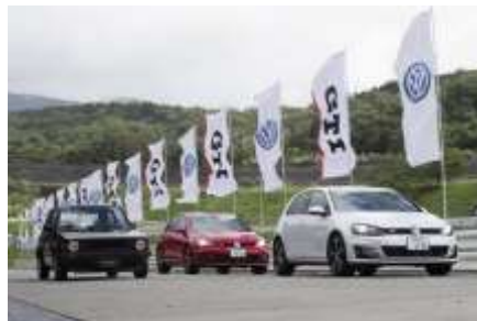
2013 富士スピードウェイショートコース