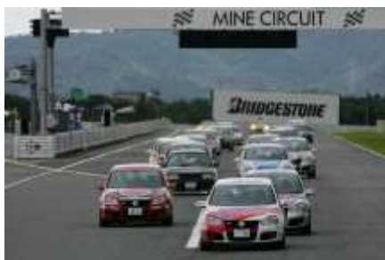
Golf GTI Cup 2005(美祢サーキット)2013

初代「Golf 1 GTI」から最新の「GTI」までが一斉にコースイン。それぞれの時代を共に過ごした VW ファンの憧れを乗せてふたたび疾走する「Golf GTI」各モデルのサウンドと走りをお楽しみください。