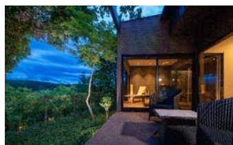
▲農のオーベルジュ 白金の森

“食事を楽しむ”をコンセプトとした2食1泊付きの宿。2300坪の広大な敷地にある客室はわずか11室。日本宿ならではのおもてなしを実感できる。