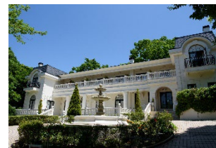
▲オーベルジュ オー・ミラドー

日本で最初に誕生したオーベルジュ。地方でしか作ることができないフランス料理を味わえる。